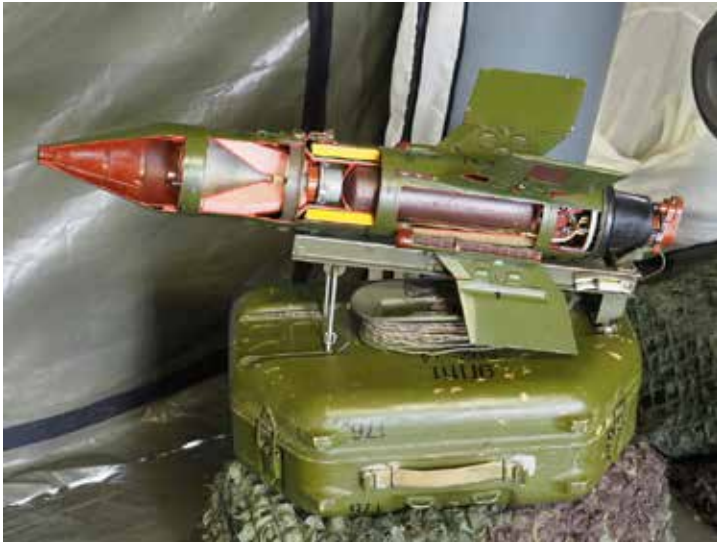
Ryc. 4. 9M14 Malutka.

W przekonaniu Ashera sowieckie opracowania przełożono na język arabski, a następnie dostosowano do możliwości i potrzeb sił egipskich.