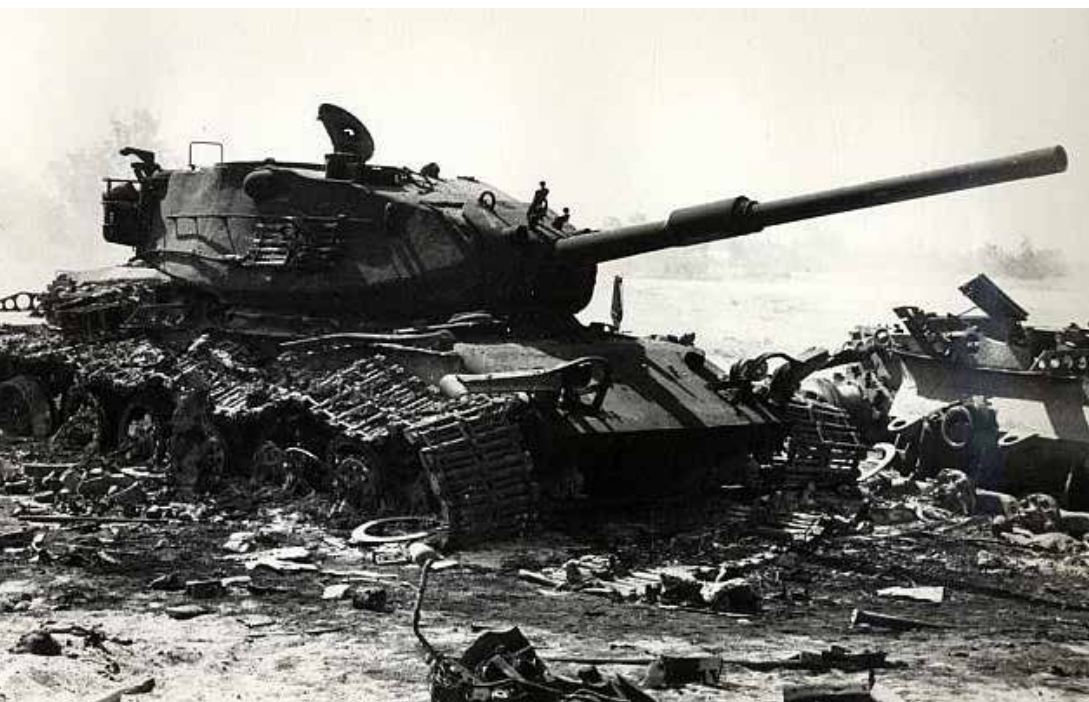
Ryc. 5. Wrak izraelskiego czołgu zniszczonego w początkowej fazie bitwy na pustyni Synaj.