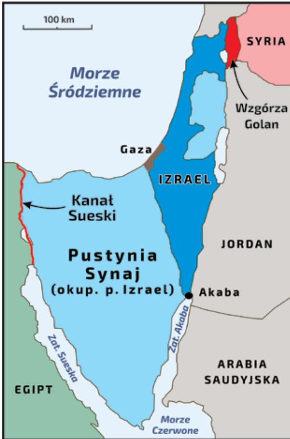
Ryc. 1. Izrael, pustynia Synaj oraz Kanał Sueski w przededniu wybuchu wojny Jom Kipur.